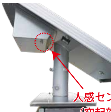
人感センサー (突起部分)